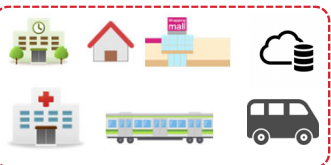
地域連携の総合的な運営体制